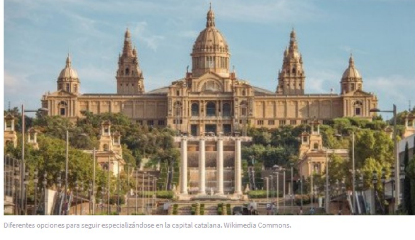
Diferentes opciones para seguir especializándose en la capital catalana. Wikimedia Commons.

La especialización en el ámbito de la psicología clínica y de la salud es una trayectoria formativa apasionante, pero no siempre es sencillo saber qué opciones elegir. Existen muchas maneras de rematar el entrenamiento y el aprendizaje obtenidos a lo largo de la carrera universitaria (de licenciatura o grado) de Psicología, y si no se quiere perder tiempo, dinero y esfuerzos, es importante atinar el tiro